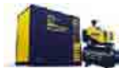
Compressores de parafuso